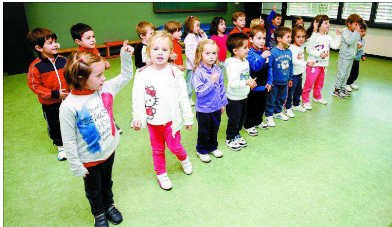
Una clase de Infantil del Centro de Educación Alonso Berruguete de Valladolid, cuya enseñanza está basada en la calidad social y académica.

EL ESCÁNER • Fundación. 1980 • Titularidad. Pública. • Ubicación. Camino Viejo de Simancas, número 21. • Oferta. Educación infantil y Primaria. • Alumnos. 671. • Profesores. 42. • Personal no docente. 2. • Equipos de Atención Temprana. Orientadora infantil, maestra de audición y lenguaje y responsable de servicios a la comunidad. • Idiomas. Inglés y Sección Bilingüe en lengua inglesa. • Informática. Dos aulas específicas, con 45 puestos; laboratorio de Idiomas con PDI y 14 puestos; seis aulas de Red XXI con Pizarra Digital; portátil profesor y miniportátiles para todos los alumnos (160). Siete Aulas Polivalentes con Pizarra Digital. • Servicios. Madrugadores, cocina propia y Comedor Escolar. • Web. http://ceipalonsoberruguete.centros.educa.jcyl.es