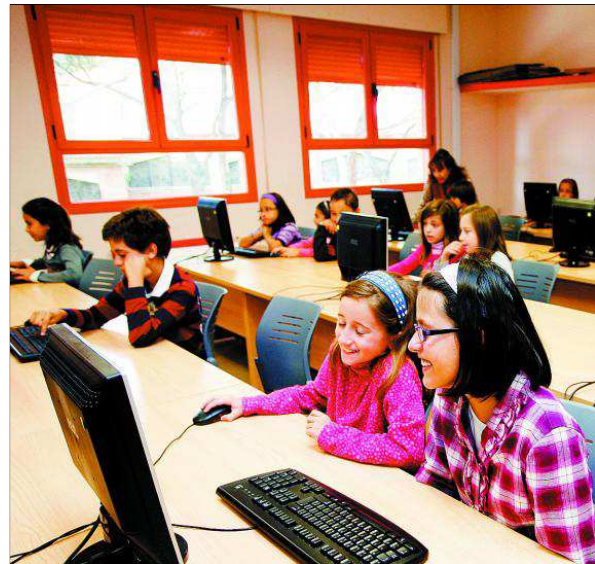
Los alumnos del CEIP Alonso Berruguete durante una clase práctica de informática.

digitalizadas y los niños y niñas disponer de unos miniportátiles para su uso, inclusive en sus casas. NUÉVOS RETOS. El director del CEIP describe también los objetivos para el curso que ha comenzado hace un mes: puesta en marcha una biblioteca de centro que complementa las existentes en las distintas aulas y desarrollar el Programa de Fomento de la Lectura con un Proyecto Dinamizador de Lectura; proyecto para Introducir la Lengua Francesa en el Tercer Ciclo de Primaria para el curso 2013/14; proyecto para la formación y cambio pedagógico con el uso de las TIC y RED XXI, buscando la eficacia en el uso de los medios y la mejora